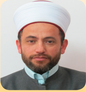
المفتي د. سعيد فرحان

«ما رأيت أحداً من المتعبدين في كثرة من لقيت منهم أشد اجتهاداً من المزني، ولا أودم على العبادة منه، وما رأيت أحداً أشد تعظيماً للعلم وأهله منه، وكان من أشد الناس تضيقاً على نفسه في الورع، وأوسع في ذلك على الناس، وكان يقول: أنا خلق من أخلاق الشافعي».