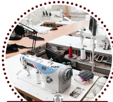
حكم زكاة البضاعة المستصفاة