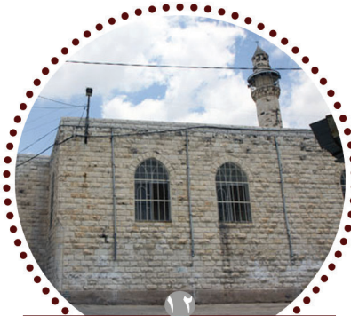
حكم هدم مصلى قديم وبناء جديد مكانه