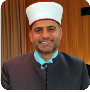
المفتي عمر الروسان