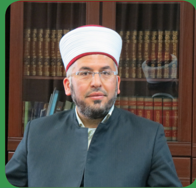
المفتي د. صفوان عضيبات

الإسلام شريعة الله الخاتمة لجميع الشرائع، والله أرسل نبيه سيدنا محمد صلى الله عليه وسلم ليبشر العالم بهذا الدين الصالح لإصلاح كل زمان ومكان، قال الله تعالى: {وَمَا أَرْسَلْنَاكَ إِلَّا كَافَّةً لِّلنَّاسِ بَشِيرًا وَنَذِيرًا وَلَكِنَّ أَكْثَرَ النَّاسِ لَا يَعْلَمُونَ} (سبأ: ٢٨)، وقال الله تعالى: {قُلْ يَا أَيُّهَا النَّاسُ إِنِّي رَسُولُ اللَّهِ إِلَيْكُمْ جَمِيعًا} (الأعراف: ١٥٨)، والقرآن الكريم جاء متناسقا تمام التناسق مع طبيعة هذا الدين الرباني، والذي يتصف بالشمولية والتوازن والواقعية، قال الله تعالى: {وَوَزَّلْنَا عَلَيْكَ الْكِتَابَ تَبْيَانًا لِّكُلِّ شَيْءٍ وَهُدًى وَرَحْمَةً وَبُشْرَىٰ لِلْمُسْلِمِينَ} (النحل: ٨٩).