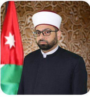
عطوفة الأمين العام